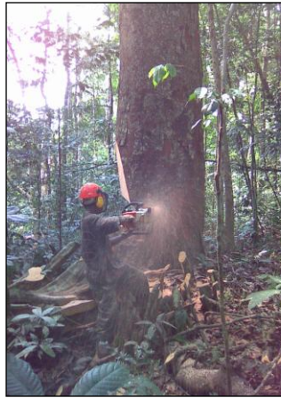
Fig. 2 Les résultats de l'étude ont montré que plusieurs entreprises atteignent un faible niveau de conformité aux exigences légales. Les plus faibles d'entre elles n'atteignant que 42% des exigences légales définies dans la grille d'évaluation. Les entreprises les plus performantes atteignent des niveaux élevés en ce qui concerne la mesure des bonnes pratiques, incluant l'abattage contrôlé (photo)